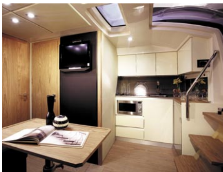
Kuchnia połączona jest z salonem, który może pełnić również funkcję jadalni