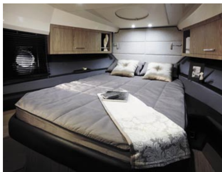
Dziobowa sypialnia armatora z dużym, podwójnym łóżem