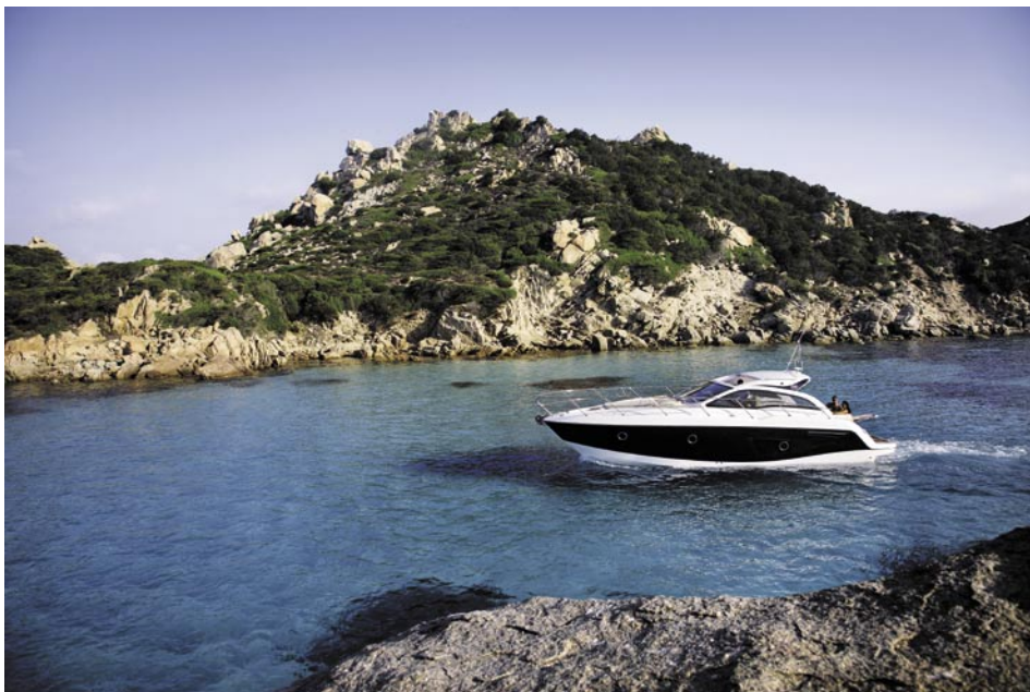
11,7-metrowa jednostka ma się stać bestsellerem stoczni Sessa

B ez wątplenia najważniejszym wydarzeniem jest premiera 16,4-metrowego jachtu Sport Fly 54, którego pierwsze zdjęcia prezentujemy na stronie 32. Pozwoli on zaspokoić dotychczasowych nabywców tej marki ceniących flybridge, ponieważ dotąd Sessa nie produkowała tego typu jednostek. Jest to także świetna okazja na znalezienie nowych klientów, którzy do tej pory nie widzieli dla siebie łodzi w jej gamie, gdyż zainteresowani są jedynie łodziami ze sterówką wewnątrz i na zewnątrz.