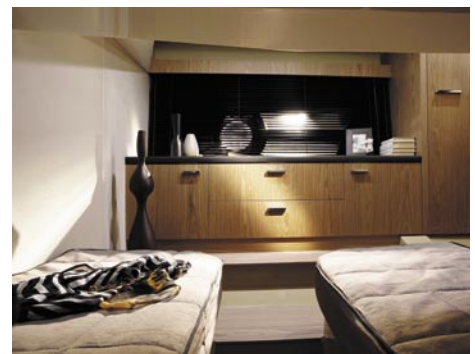
W rufowej sypialni znajdują się dwie pojedyncze koje, które mogą zostać złączone w jedną podwójną