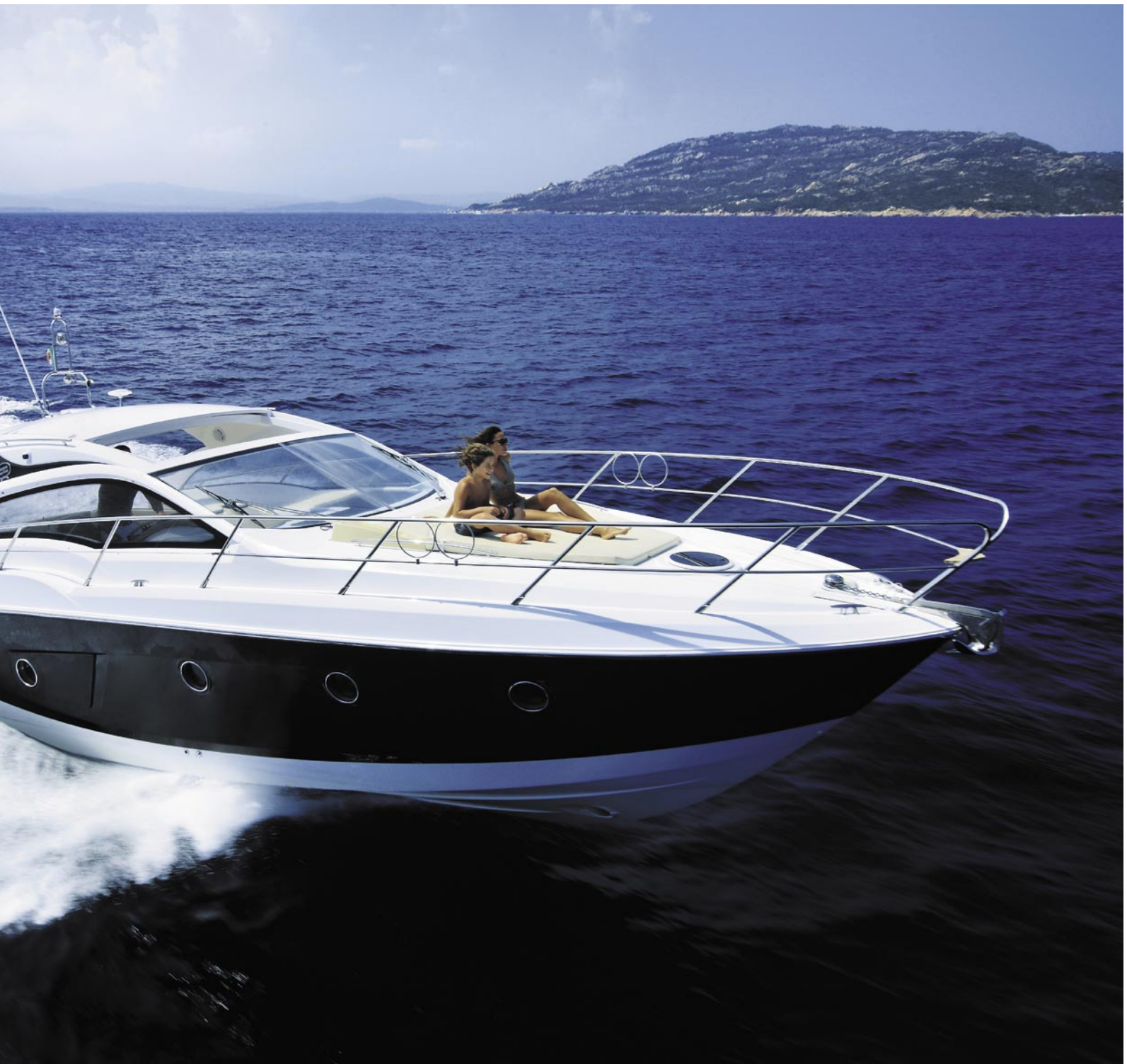
Łódź osiąga maksymalną prędkość 34,5 węzła (63,9 km/h) przy 3550 obr/min