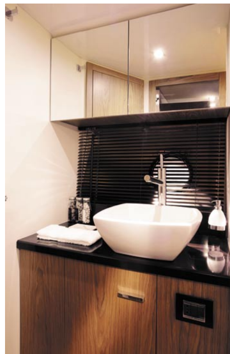
Stocznia chwali się, że jej C38 ma jedną z największych łazienek w swojej klasie łodzi