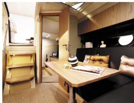
Sypialnia rufowa, podobnie jak dziobowa, jest oddzielna i zamykana